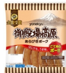
御殿場高原®あらびきポーク